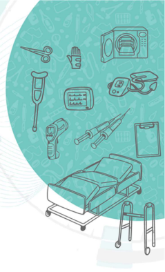
Table Opératoire Hydraulique Fiche Technique